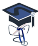
Εικόνα 1: ΔΔΠΜΣ «Διδακτική των Επιστημών και Σύγχρονες Τεχνολογίες»

Τα σχήματα, οι εικόνες και οι πίνακες θα πρέπει να είναι στοιχισμένες στο κέντρο της σελίδας. Το ίδιο ισχύει και για τους τίτλους τους. Η δε μορφοποίησή τους πρέπει να είναι η ακόλουθη: