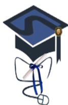
Εικόνα 1: ΔΙΠΜΣ «Διδακτική των Επιστημών και Σύγχρονες Τεχνολογίες»

Τα σχήματα, οι εικόνες και οι πίνακες θα πρέπει να είναι στοιχισμένες στο κέντρο της σελίδας. Το ίδιο ισχύει και για τους τίτλους τους. Η δε μορφοποίησή τους πρέπει να είναι η ακόλουθη: